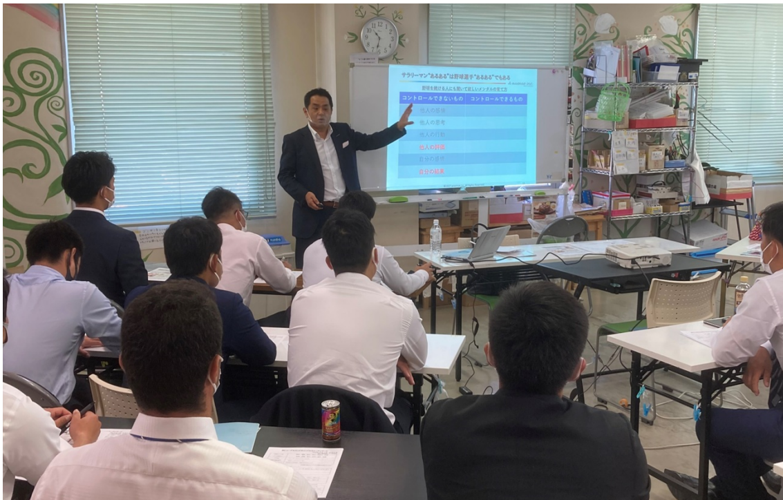
代表杉山が登壇の2020年BCリーグセカンドキャリアセミナーの風景